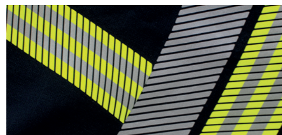
Reflexgewebe silber & segmentiertes Reflexgewebe

Lieferbare Größen: S bis 4XL, K-S bis K-4XL, L-S bis L-4XL