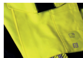
RFID, NFC Chip, QR-Code