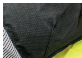
T6018 3D System