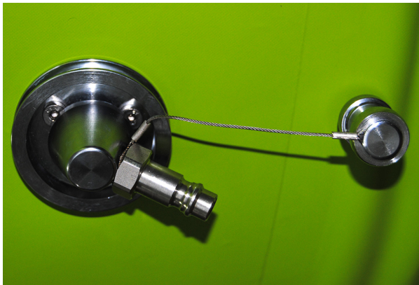
Außenansicht des SCBA Dekoanschlusses. Stecknippel zum Anschluss des Versorgungsschlauches mit Schutzkappe und Kappensicherung.