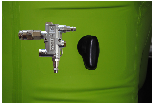
Außenanschluss mit Abdeckkappe und beigelegtem automatischen Schaltventil (ASV) ohne Pfeife (10055365).

Der SCBA Dekoanschluss ist ein externer Luftanschluss für die Versorgung des Geräteträgers mit Atemluft bei Dekontamination nach dem Einsatz. Falls zu wenig Atemluft im Pressluftatmer für die Dekozwecke vorhanden ist oder eine unwahrscheinliche Störung des Pressluftatmers vorliegt, wird der Anzugträger über ein Druckluft-Schlauchsystem mit Atemluft versorgt. Dabei schaltet das ASV automatisch die Atemluftversorgung vom Pressluftatmer auf die externe Druckluftversorgung um.