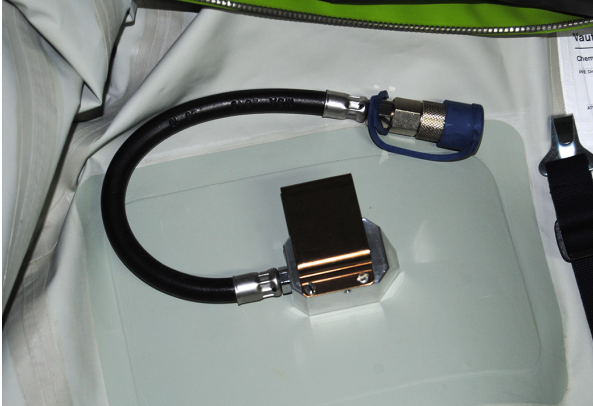
Innenansicht SCBA Dekoanschluss mit montierter Mitteldruckleitung.