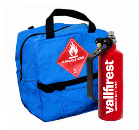
Tasche aus Nylon für 6 Brandfackeln mit Einstellgurten im Inneren, um abrupte Bewegungen zu verhindern.