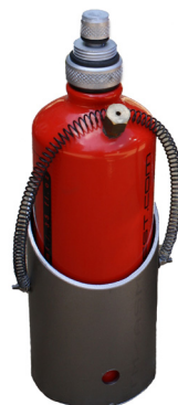
Halterung für Fahrzeuge.