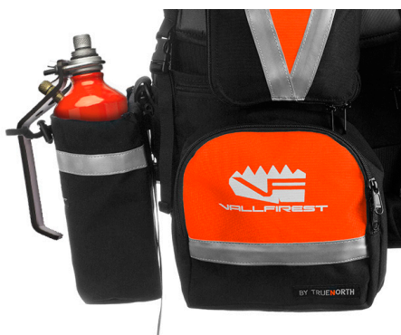
Transport an Gürtel oder Rucksack.

Kompakte Größe ideal für per Hubschrauber transportierte Einsatzgruppen und für Fahrzeuge der Einsatzleitung und Brandanalyse.