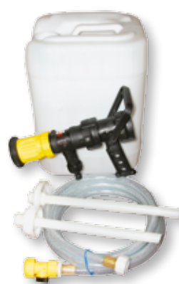
4047-PP30 110 l/min Gel Kit mit Saugschlauch für Kanister-Ansaugung (Kanister nicht im Lieferumfang enthalten)