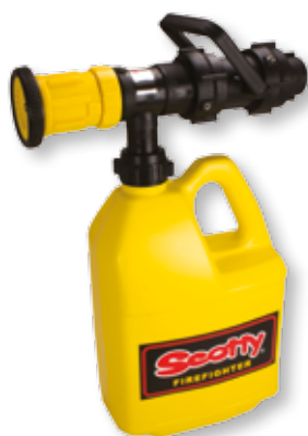
4047-15 60 l/min Gel Kit