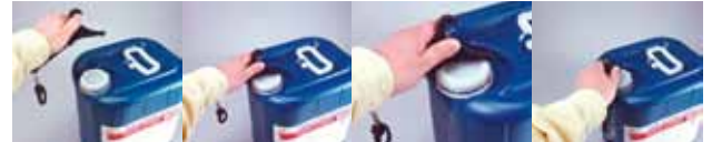
Die Szene zeigt den Einsatz des Kupplungsschlüssels 4577 zum Öffnen von Schaummittelkanistern.