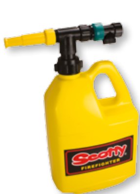
4047-3 12 l/min Gel Kit