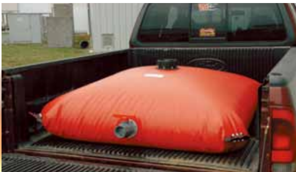
4550-500 Tank gefüllt in einem Pick-Up Geländewagen