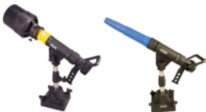
Mini Monitor mit 4039 Mittel- schaumdüse

Gefertigt aus glasfaserverstärktem Nylon (Ny-Glass) ist der Minimonitor extrem robust und widerstandsfähig. Das Schwerschaumrohr ist aus schlagfestem ABS Polymer gefertigt. Mini Monitore sind für einen Druck von 3,5 bar bis 10 bar ausgelegt.