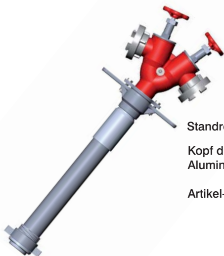
Standrohr 2 x B Kopf drehbar Aluminium-Legierung Artikel-Nr.: 401044