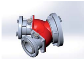
Sammelstück BB/A nach DIN 14355, kg 3,5 Aluminium-Legierung Ausgang drehbar Artikel-Nr.: 306412