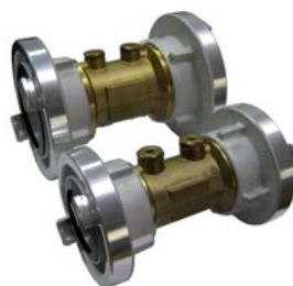
Rückflussverhinderer C + B Messing, Aluminium-Legierung

Artikel-Nr.: C- 307530 Artikel-Nr.: B- 307521